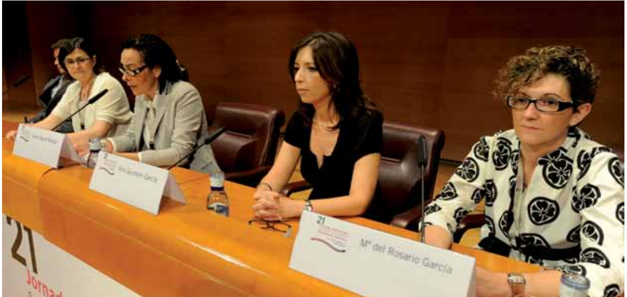
1ª Mesa redonda