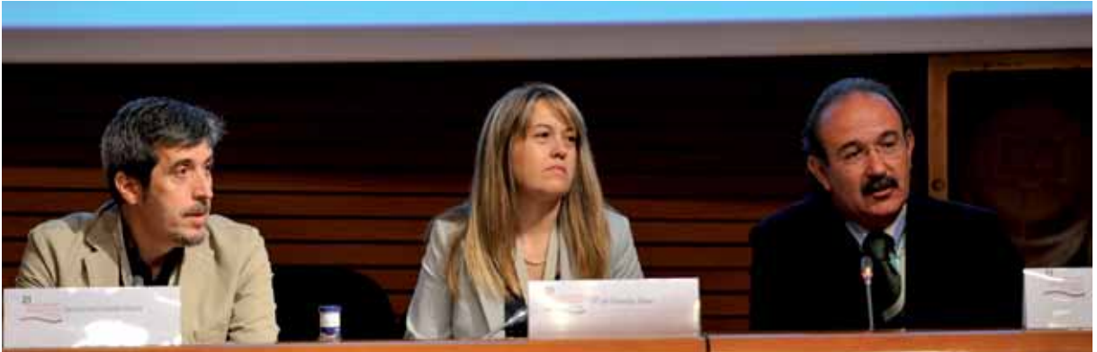
Desayuno con expertos 3

ción y la comunicación (TIC) en el campo de acción del enfermero. Sosteniendo que podría reforzar, si se generaliza, el papel de “puente” que ejerce este profesional entre el paciente, la Atención Primaria y la Atención Especializada, a tenor de la experiencia de este tipo en el hospital donde trabaja. Cabe resaltar en conclusión, según palabras de la ponente, que la telemedicina potenciará el papel de la “enfermera de enlace”, para lo que deberá ayudarse de programas informáticos de seguimiento. Estas herramientas, sin duda, hacen disminuir el número de visitas a domicilio.