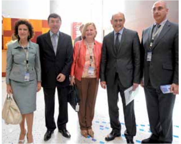
Autoridades en el Acto Inaugural

aportar soluciones para la gestión, soluciones sostenibles e innovadoras que contribuyan a lograr un avance integrador entre los diferentes agentes que conforman el Sistema de Salud. Para abordar estos objetivos, el programa científico se organizó en torno a cinco mesas: