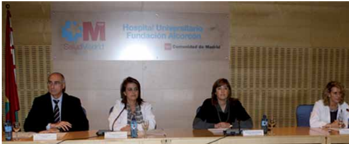
Mesa Jornada de Madrid