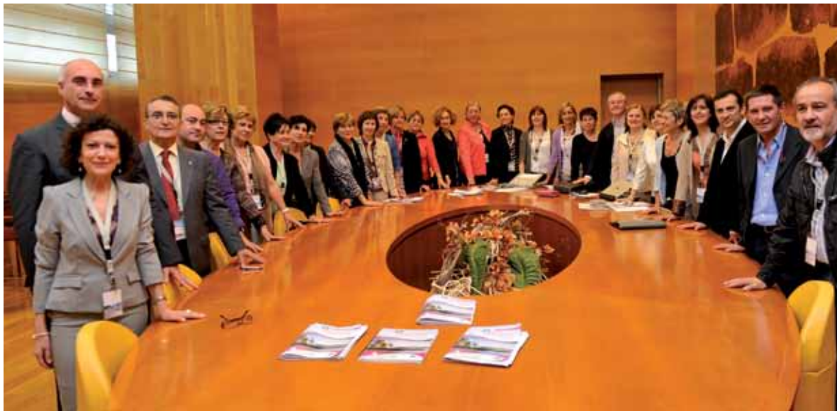
Comités Jornadas de Supervisión

empeño para tener el espacio que nos corresponde dentro de la asistencia que prestamos a los ciudadanos.